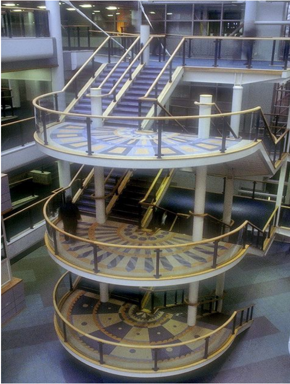
Trap met marmoleum, een exclusie ontwerp