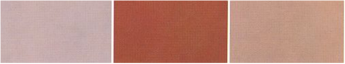
Afbeelding 23 basiskleuren in de egaline

Er zijn 3 basiskleuren in de egaline te verkrijgen, maar wanneer uw kleur hier niet bij zit schrik dan niet want we kunnen nog andere kleuren en uitvoeringen maken, we hebben het op pagina 1 over 2000 en 4 mogelijkheden.